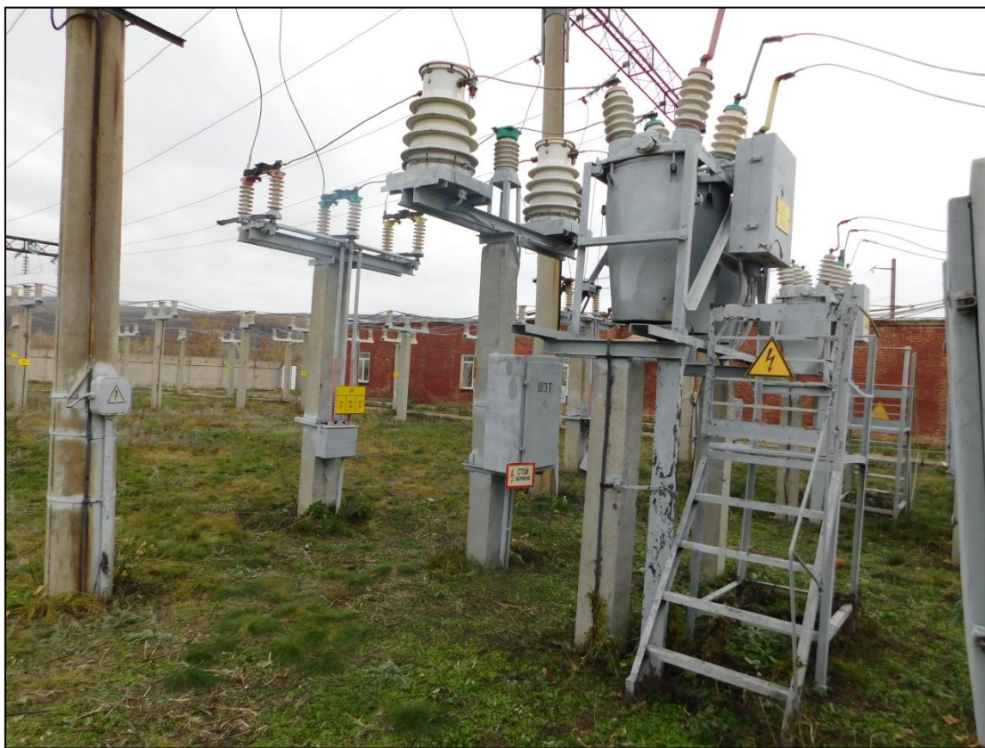
Место происшествия со стороны выключателя В-35 2Т

Во время осуществления допуска бригады № 2 бригада № 1 покинула для перерыва на обед рабочее место на В-110 1Т (вышла за территорию подстанции через западные ворота).