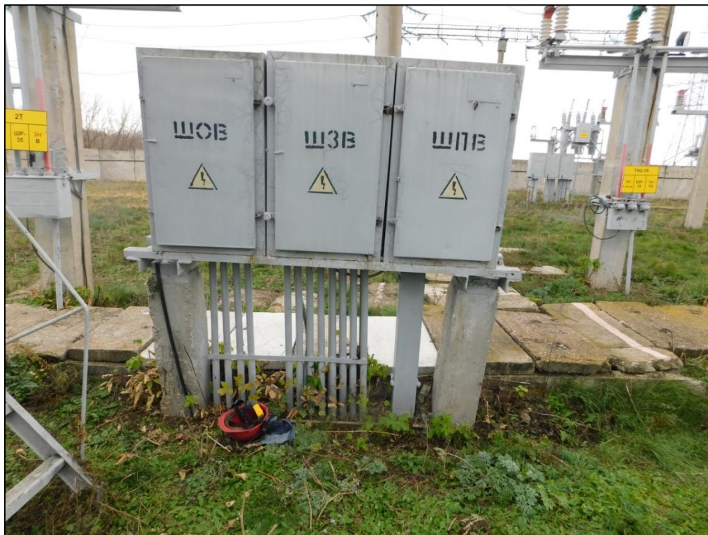
Каска термостойкая и ветошь пострадавшего