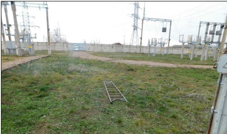
Переносная стеклопластиковая лестница

с территории подстанции, после выезда бригадного автомобиля закрыли ворота с внутренней стороны. После выхода с территории подстанции через металлическую дверь (калитку) мастер прикрыл дверь, на замок металлическая дверь (калитка) не закрывалась ввиду отсутствия ключа.