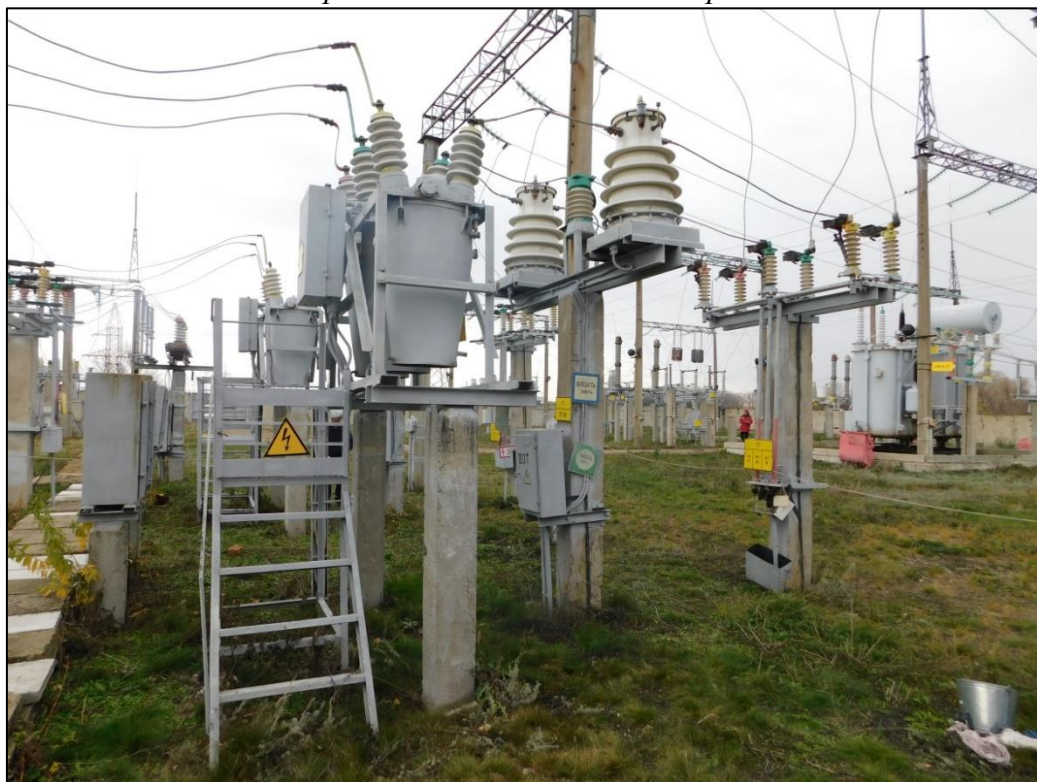
Рабочее место бригады № 2

В 13:41 электрослесарь 1, электрослесарь 2, электрослесарь 3 услышали хлопок с территории подстанции 110 кВ Белая. Электрослесарь 1 открыл калитку западных ворот на подстанцию 110 кВ Белая и увидел лежащего на земле электрослесаря 4 между выключателем В-35 2Т и трансформаторами тока ТТ-35 2Т соседнего присоединения, находящегося под напряжением, ногами в сторону