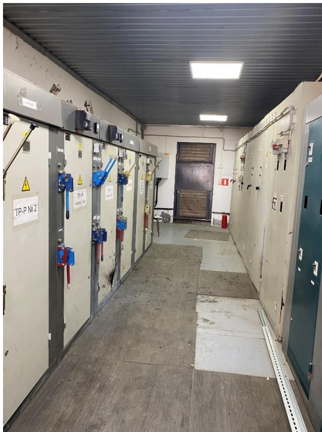
ТП (ЗРУ 6/0,4 кВ)

не проводился. Командированный персонал ООО «ЮгЭнергоРесурс» не был ознакомлен с электрической схемой и особенностями электроустановки, в которой им предстоит работать, а работники, которым предоставляется право выдачи наряда, исполнять обязанности ответственного руководителя и производителя работ, не прошли инструктаж по схеме электроснабжения электроустановки.