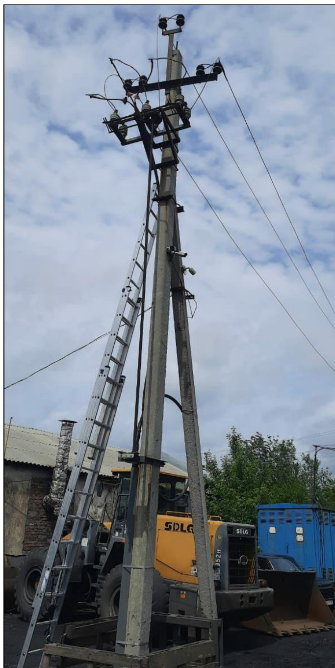
Опора № 7/1 воздушной линии электропередачи 6 кВ Л-815

к конструкции РЛНД, ЭМ1 коснулся правой рукой подвижного контакта ф. «В» разъединителя и был поражён электрическим током. Прибывшая бригада скорой медицинской помощи констатировала смерть ЭМ1.