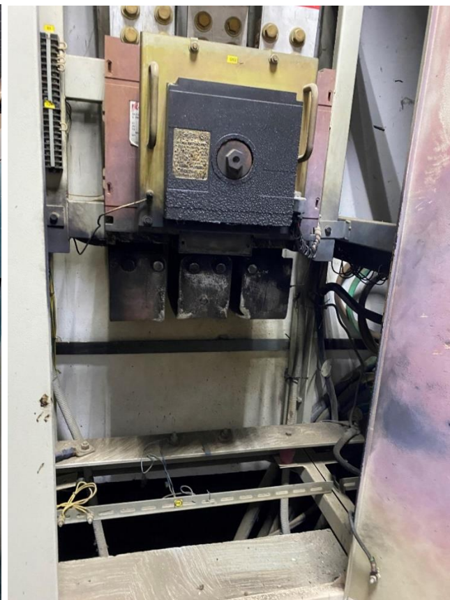
Шкаф 0,4 кВ № 2 «Перекресток ввод № 2»

Предоставление командированному персоналу ООО «ЮгЭнергоРесурс» права работы в действующих электроустановках в качестве выдающих наряд, ответственных руководителей и производителей работ, наблюдающих, членов бригады, путём оформления руководителем ООО «ИЦ «ГиСМ» – владельцем электроустановки, резолюции на письме командировающей организации, выполнено не было.