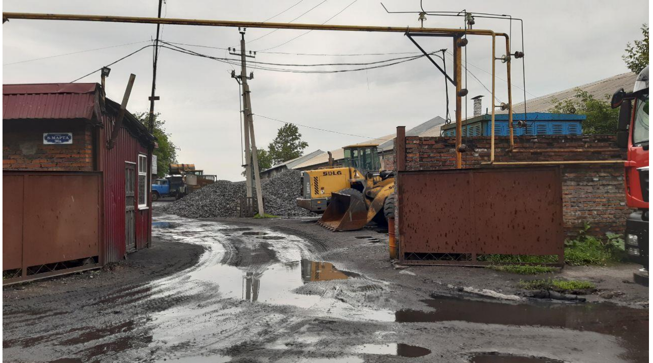
Опора № 7/1 воздушной линии электропередачи 6 кВ Л-815

ремонтно-производственной базы Артёмовского участка обе бригады выехали на бригадном автомобиле. При этом на багажную систему крыши автомобиля прикреплена алюминиевая лестница, не являющаяся инвентарным средством подъёма на высоту.