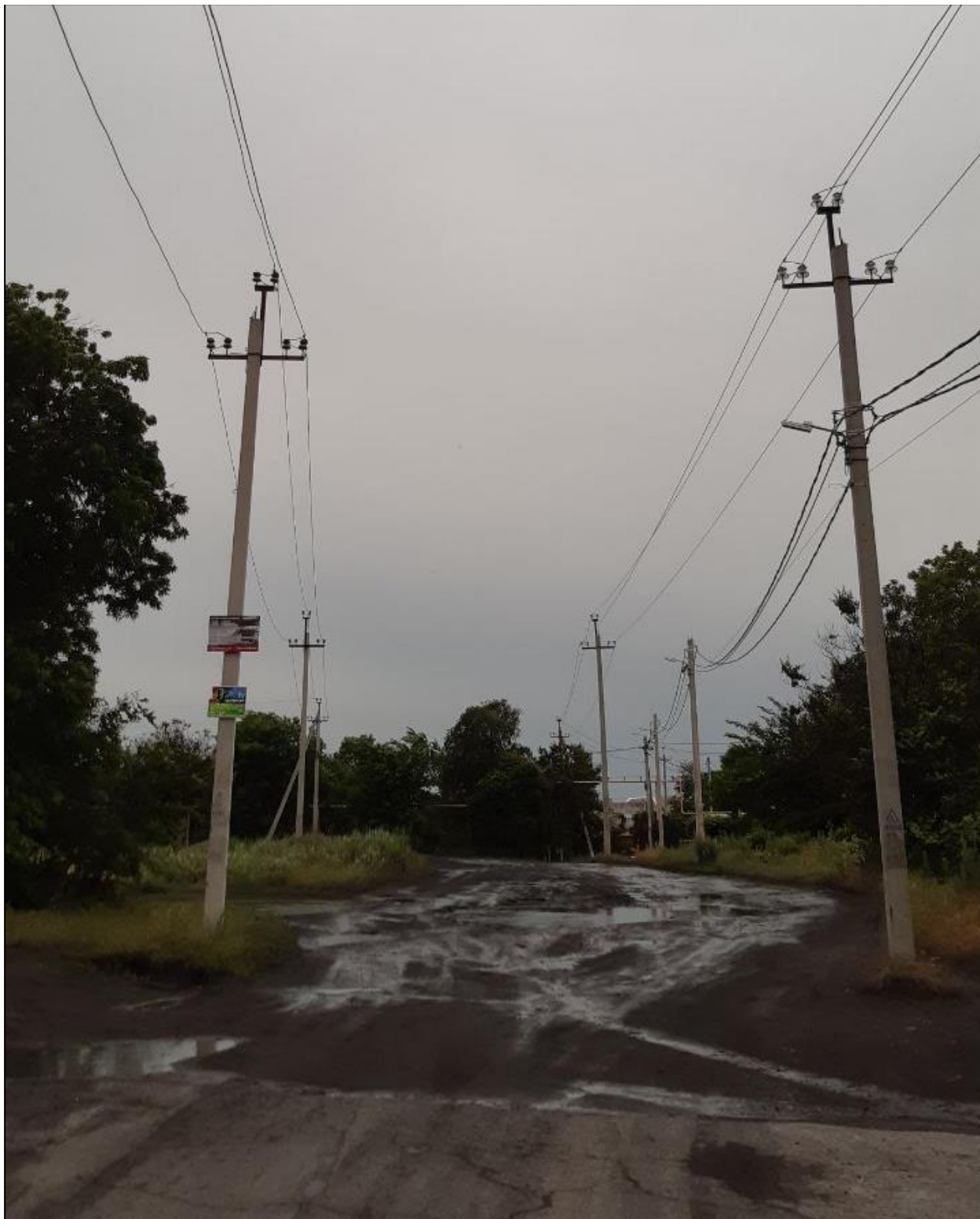
Воздушные линии электропередачи 6 кВ Л-815 (левее) и Л-805 (правее)

После отключения ТП-188 совместно принято решение об отключении ТП-0394, технологически подключённую к ВЛ-6 кВ Л-815, территориально находящуюся по близости. ЭМ1, ЭМ2 и ДЭМ, расширив объём задания, попытались отключить разъединитель на опоре № 7/1 в сторону ТП-0394. Разъединитель не отключился. В целях осмотра разъединителя ЭМ2 и ДЭМ принесена и установлена к опоре неинвентарная металлическая раздвижная лестница, по которой ЭМ1 поднялся к конструкции разъединителя. При этом ЭМ1