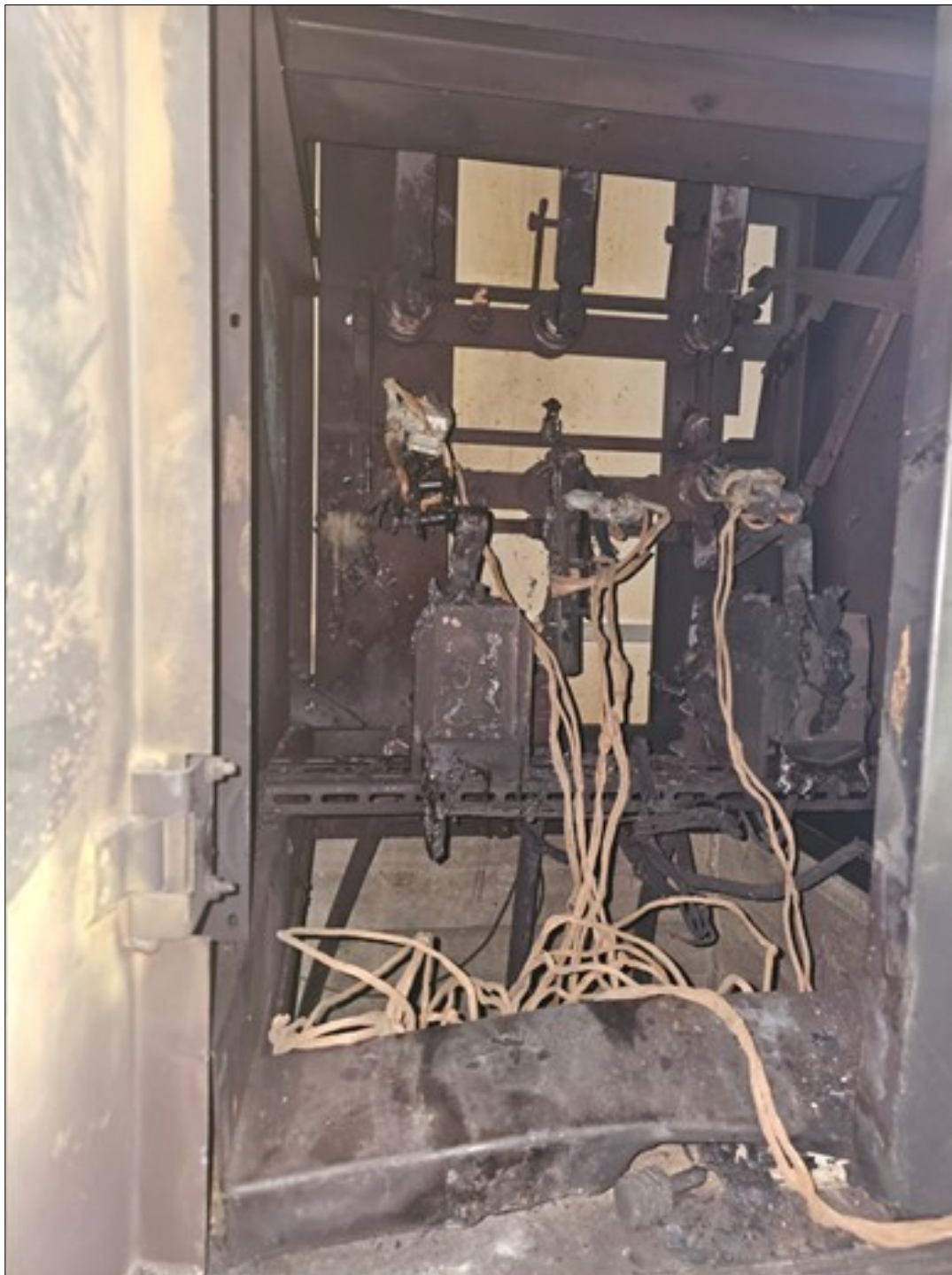
Ячейка № 1, в которой произошёл несчастный случай. Шины в верхней части ячейки находились под напряжением во время производства работ

Работники скорой медицинской помощи по окончании осмотра констатировали смерть.