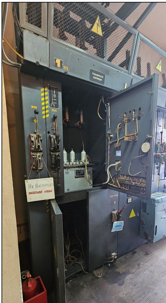
Ячейка № 1, в нижнем отсеке которой произошёл несчастный случай