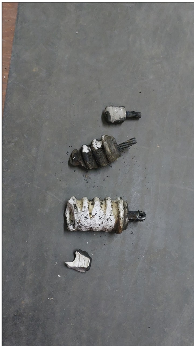
Изоляторы линейного разъединителя ЛР-1, демонтированные электромонтёром до несчастного случая

В 15:00 электромонтёр самовольно (без получения команды вышестоящего административно-технического персонала) прибыл на РП-25, открыл РУ-10 кВ РП-25, зашёл внутрь и приступил к ремонту поврежденного оборудования ячейки № 1 без проведения организационных и технических мероприятий. При производстве работ, сняв два изолятора линейного разъединителя ЛР1, он допустил приближение к токоведущим частям, находящимся под напряжением (шины, приходящие в ячейку № 1 от секции шин), на расстояние менее допустимого. Работник, находившийся рядом с РП-25, услышал треск, заглянул в подстанцию, где увидел горевшего электромонтёра в ячейке № 1 и приступил к тушению его огнетушителем. Прибывший на место главный энергетик (из-за короткого замыкания произошло отключение электроэнергии на всём предприятии) вызвал скорую помощь.